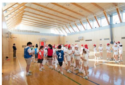
プレイルーム(体育館)