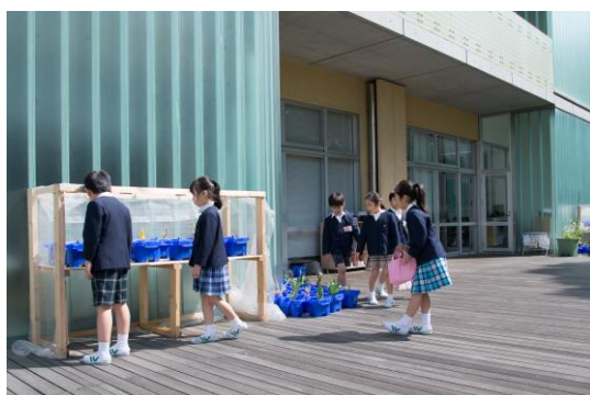
低学年教室前のウッドデッキ